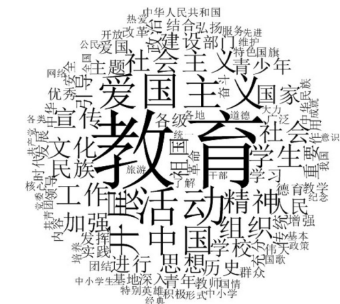
图2 爱国主义教育制度前100高频词词云图